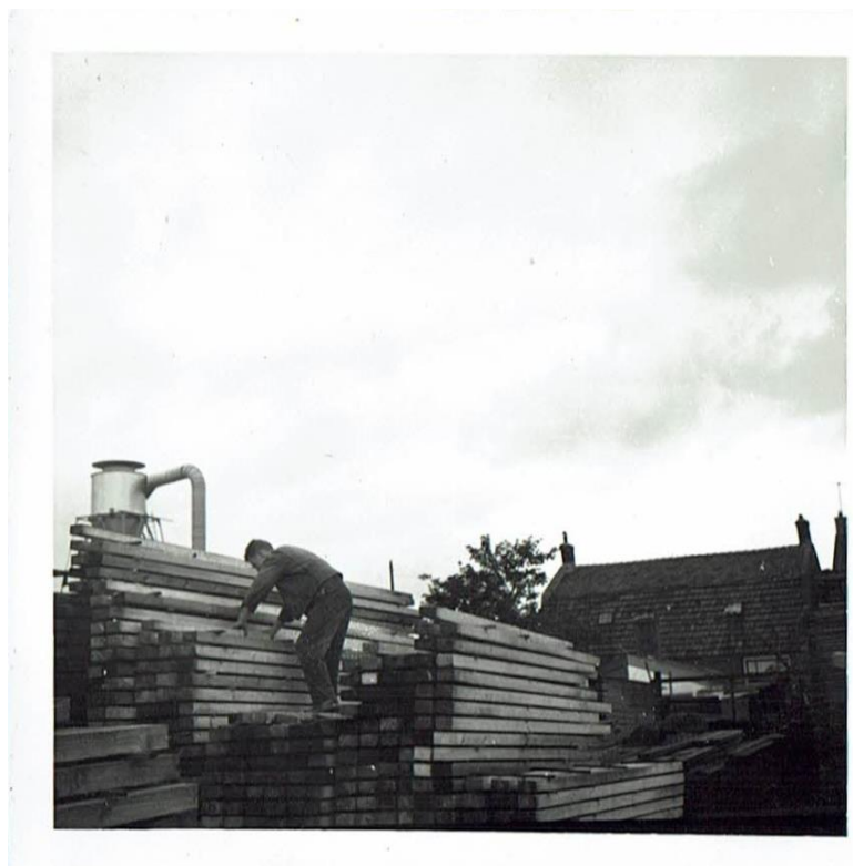
Een unieke foto van Vinken houthandel !

In deze nieuwsbrief gaan we verder met de rubriek “Blik op het verleden van de Sluisdijkbuurt”. We nemen u mee aan de hand van o.a. oude foto's van het Vinkenterrein maar ook van de Sluisdijkbuurt / Visbuurt. De tijd dat de Fabrieks- en Steengracht werden gedempt en de tijd dat het voormalige Vinkenterrein in gebruik was voor de houthandel 😊