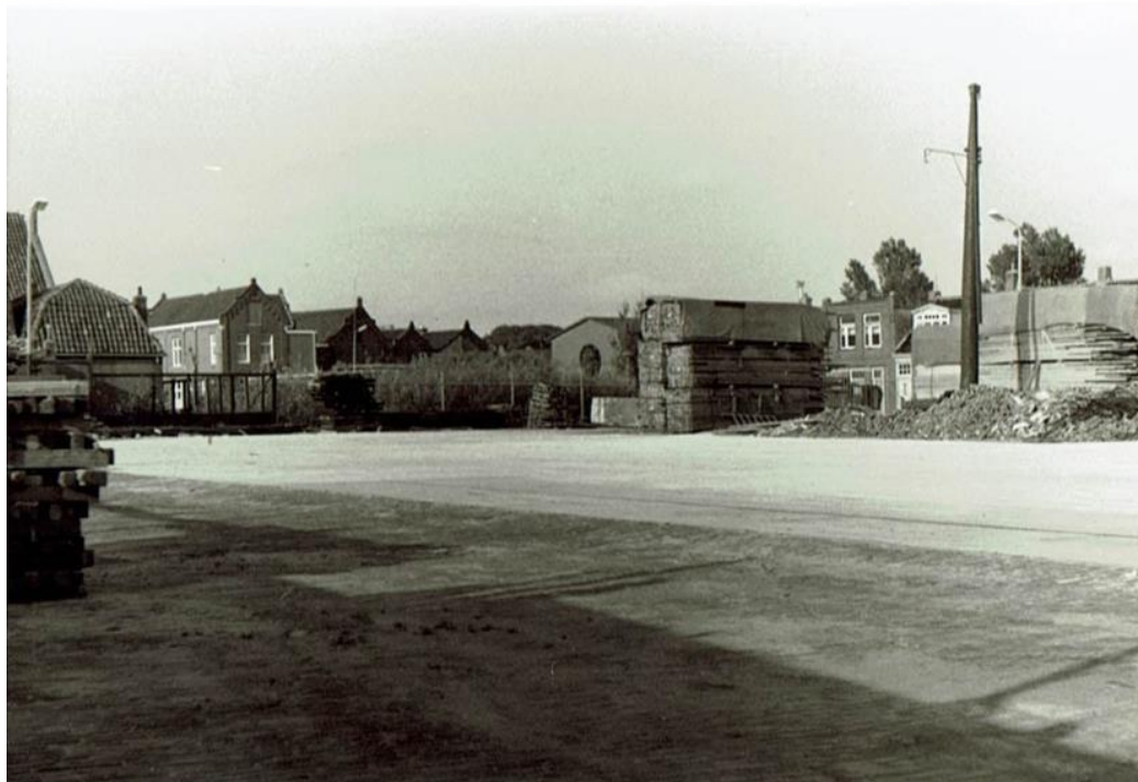
Een unieke foto van Vinken houthandel !

In deze nieuwsbrief gaan we verder met de rubriek “Blik op het verleden van de Sluisdijkbuurt”. We nemen u mee aan de hand van o.a. oude foto's van het Vinkenterrein maar ook van de Sluisdijkbuurt / Visbuurt. De tijd dat de Fabrieks- en Steengracht werden gedempt en de tijd dat het voormalige Vinkenterrein in gebruik was voor de houthandel 😊