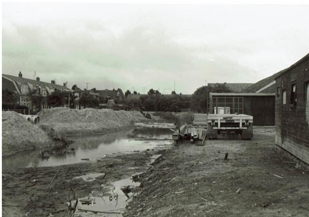
Dempen gracht in volle gang !