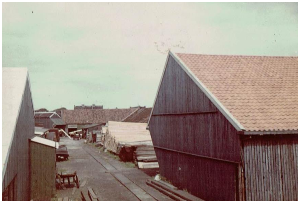
Een unieke foto van Vinken houthandel !

In deze nieuwsbrief gaan we verder met de rubriek “Blik op het verleden van de Sluisdijkbuurt”. We nemen u mee aan de hand van o.a. oude foto's van het Vinkenterrein maar ook van de Sluisdijkbuurt / Visbuurt. De tijd dat de Fabrieks- en Steengracht werden gedempt en de tijd dat het voormalige Vinkenterrein in gebruik was voor de houthandel 😊