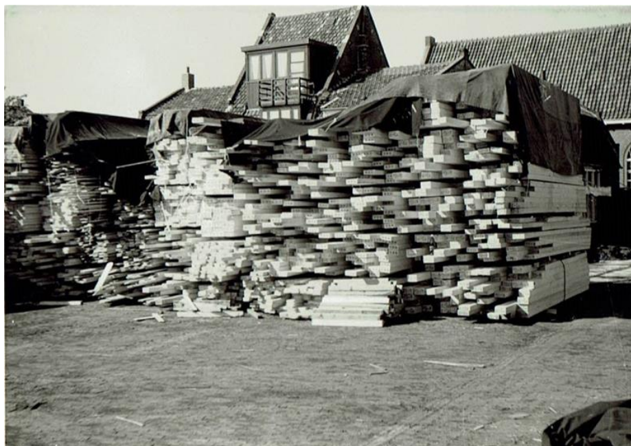
Er ligt weer een stapel hout klaar .. op de achtergrond het kerkje aan de Steengracht

In deze nieuwsbrief gaan we verder met de rubriek “Blik op het verleden van de Sluisdijkbuurt”. We nemen u mee aan de hand van oude foto’s van het Vinkenterrein maar ook van de Sluisdijkbuurt / Visbuurt. De tijd dat de Fabrieks- en Steengracht werden gedempt en de tijd dat het voormalige Vinkenterrein in gebruik was voor de houthandel 😊