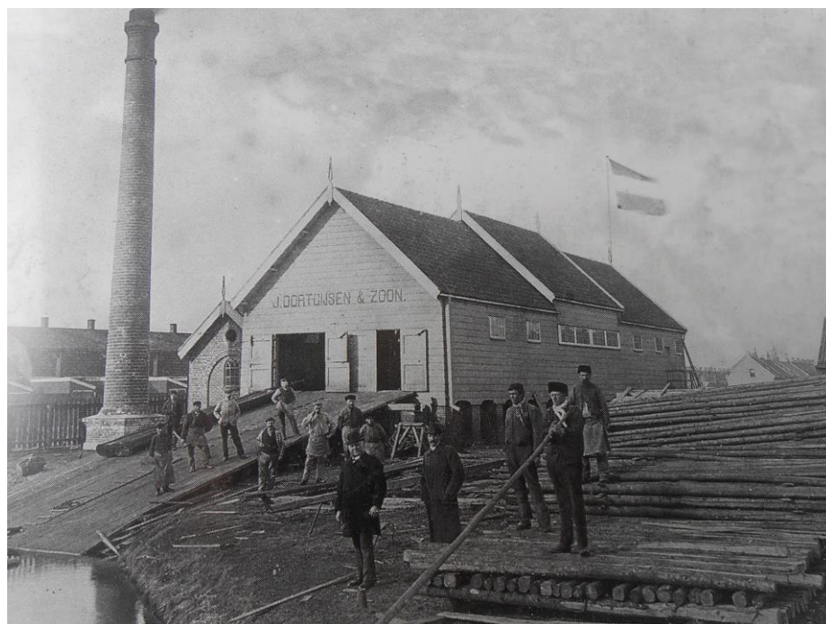
Een unieke foto van houthandel J. Oortgijsen & Zoon